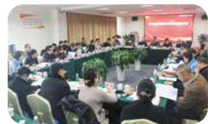
“四川省装配式建筑发展座谈会”