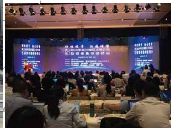
四川辖区上市公司投资者集体接待