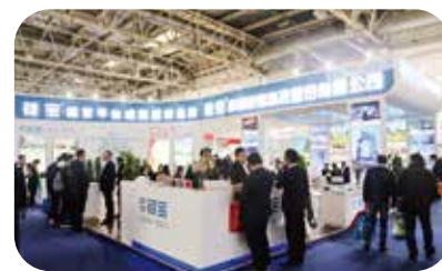
2018年10月，中国国际门窗幕墙博览会暨中国国际建筑系统及材料博览会