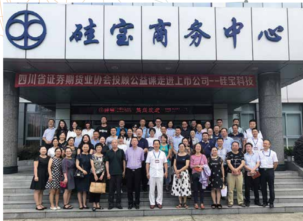
期货业协会投资公益课走进硅宝科技

公司继续坚持通过“走出去”+“引进来”的方式，积极与广大投资者互动。2018年，公司多次参加投资者策略会，积极邀请投资者走进上市公司，接待个人、机构调研30余次，先后举办了三次大型“投资者走进上市公司”活动，便于投资者更深层了解公司的经营情况和未来发展方向。