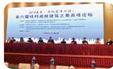
“2018建筑、结构巅峰对话——第六届结构成就建筑之美高峰论坛”