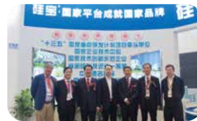
2018年4月，二十九届中国国际玻璃展览会

2018年，公司应邀出席“中国电机工程学会电力土建专业委员会结构分专委会第十一次学术研讨会”、“2018建筑、结构巅峰对话——第六届结构成就建筑之美高峰论坛”、“第十七届中国北京国际住宅产业暨建筑工业化产品与设备博览会”、“2018深圳国际锂电技术展览会（IBTE）”、“二十九届中国国际玻璃展览会”、“四川省装配式建筑发展座谈会”、“第24届全国铝门窗幕墙新产品博览会”等大型会议，提升了公司品牌知名度和美誉度的同时，为行业发展壮大贡献一份力量。