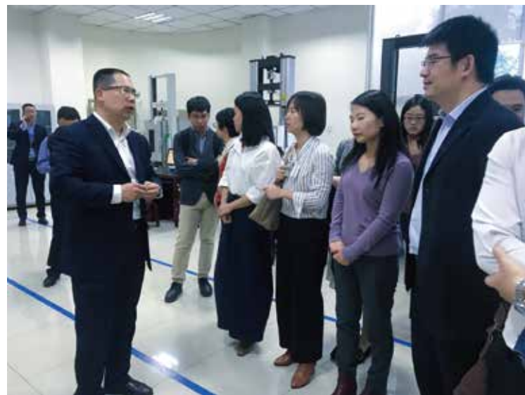
深圳证券交易所创业板公司管理部走访硅宝科技

2018年，公司按照中国证监会和深圳证券交易所的有关要求，及时、准确、公平的完成了定期报告和临时报告的编制披露工作，在巨潮资讯网共发布公告102份，确保所有股东能够公平、公正的获得公司信息，使广大投资者能够及时、全面的了解公司经营情况、财务状况、各项重大事项进展等情况。