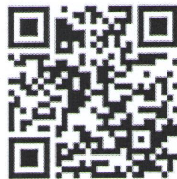
中国机械工业出版社