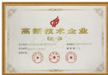
高新技术企业证书

在社会领域上，荣获“高新技术企业”、合肥市“专精特新”中小企业、等光荣称号；公司曾被评为5A级安徽机械制造业安全生产诚信企业。