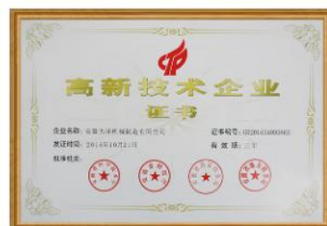
高新技术企业证书