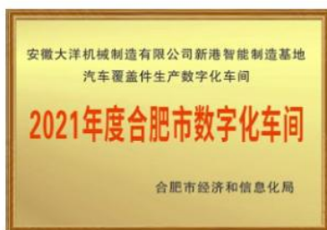
2021年度合肥市数字化车间