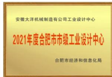
2021合肥市市级工业设计中心