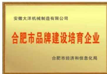
合肥市品牌建设培育企业