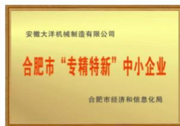
合肥市“专精特新”中小企业